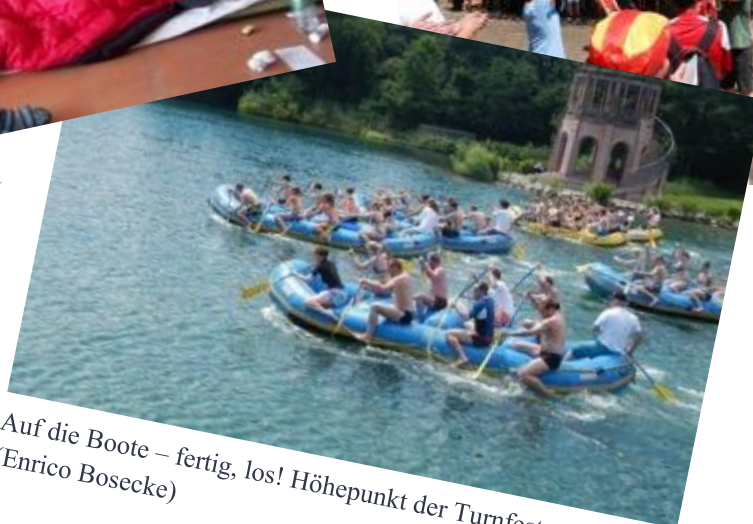
Auf die Boote – fertig, los! Höhepunkt der Turnfeste (Enrico Bosecke)