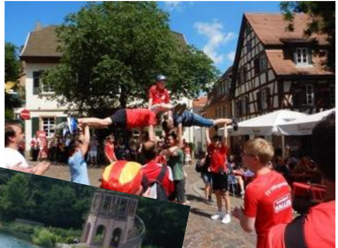
Mitten in der Stadt: Turnfest-Impression (Enrico Bosecke)